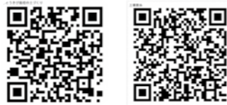
緩効性肥料って？ 土壌害虫防除